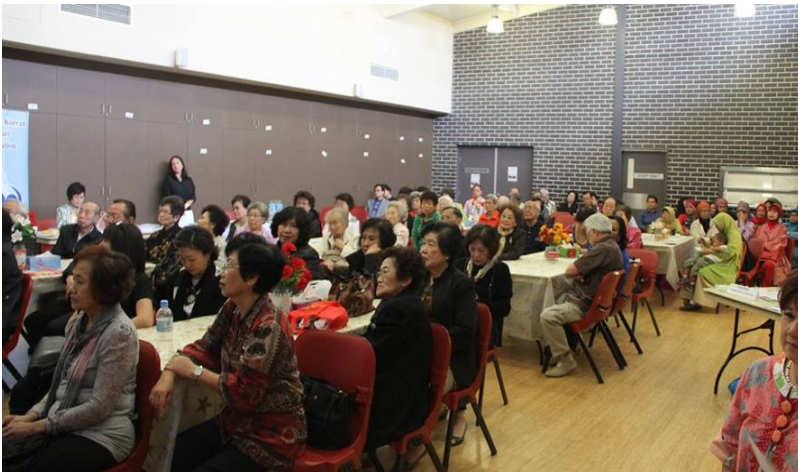
간병인을 위한 축하행사에서 간병인 관련 정보를 듣고 있는 참석자들, 펀치볼 커뮤니티센터( 2014.10.14)

한인복지회 HAP팀은 Carers week를 맞이하여서 인도네시아 복지회와 함께 2014년 10월 14일(화요일) 펀치볼 커뮤니티 센터에서 2014년 간병인을 위한 축하행사를 개최하였습니다.