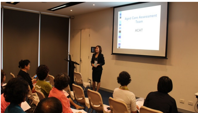
노인복지 정보 세미나, 스트라스필드 도서관 (2014.3.27)

HAP 프로젝트의 일환으로 호주의 노인복지 정보를 제공하는 노인복지 정보 세미나와 간병인을 위한 축하행사가 개최되었습니다. 2014년 3월 27일 스트라스필드 도서관, 10월 14일 펀치볼 커뮤니티센터, 11월 5일 리젠츠파크 커뮤니티센터에서 정보세미나가 차례로 열렸으며, 개최를 거듭할수록 참석자들의 관심과 호응도가 증가하고 있습니다.